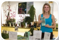
24-25-26 mai 2007 Rendez-vous horticole 2007

C'est avec plaisir que nous avons soutenu pour une autre année le Rendez-vous horticole 2007, qui accueille plus de 18 000 visiteurs. Cette année, nous avons tenu un kiosque donnant de l'information sur la Fondation aux visiteurs. Grâce à la généreuse contribution des différents artisans participant au Rendez-vous horticole, qui ont fournis la grande majorité des prix, nous avons organisé de nombreux tirages. Suite à cette longue fin de semaine, la Fondation a remis quelque 70 prix et s'est fait connaître par les visiteurs.