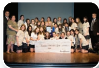
7 juin 2007 La Palme verte – Gala de remise

botanique. La Fondation a inauguré le 31 mai 2007 cette Place des donateurs, située aux pieds de la statue Marie Victorin, afin de rendre hommage aux individus et familles qui ont contribué financièrement à sa campagne de levée de fonds. Cette campagne a rapporté un montant de 107 000 $ en 2006-2007 et, en guise de reconnaissance, le nom de chacun des donateurs est maintenant gravé sur une des pierres qui composent la Place des donateurs. Et cette campagne se poursuit.