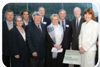
31 mai 2007 Inauguration de la Place des donateurs

C'est avec plaisir que nous avons soutenu pour une autre année le Rendez-vous horticole 2007, qui accueille plus de 18 000 visiteurs. Cette année, nous avons tenu un kiosque donnant de l'information sur la Fondation aux visiteurs. Grâce à la généreuse contribution des différents artisans participant au Rendez-vous horticole, qui ont fournis la grande majorité des prix, nous avons organisé de nombreux tirages. Suite à cette longue fin de semaine, la Fondation a remis quelque 70 prix et s'est fait connaître par les visiteurs.